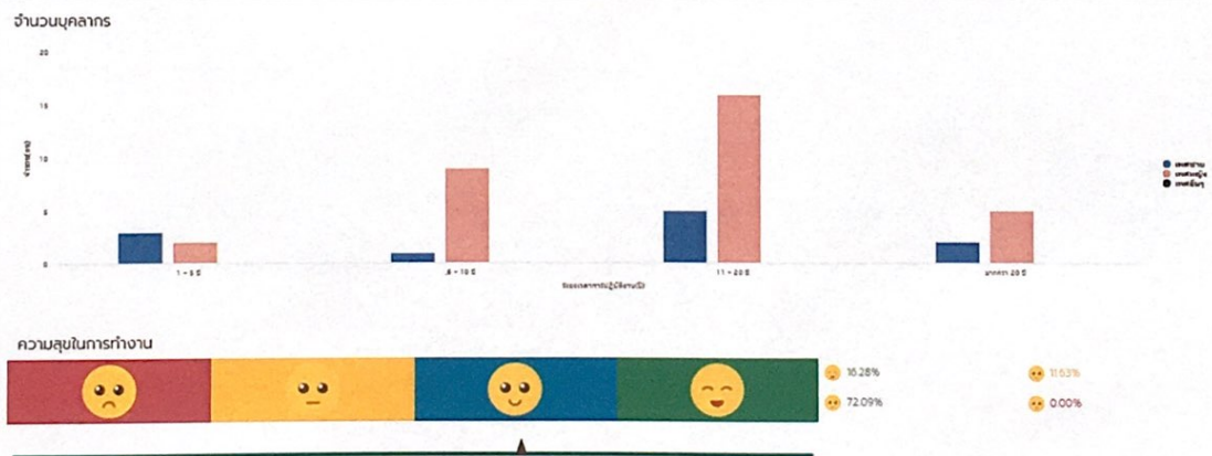
สภาพแวดล้อมการทำงานของเจ้าหน้าที่ในหน่วยงานภาครัฐ ประจำปี 2565